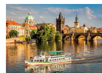
Reconduction de Prague

Les propositions UNSA étaient les suivantes :