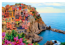
Les Cinque terre (Italie)